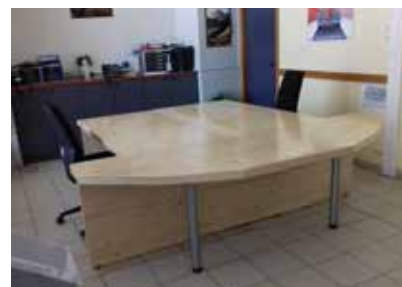
Accueil de la Mairie