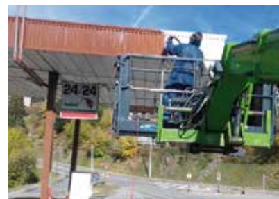
Peinture de la station-service