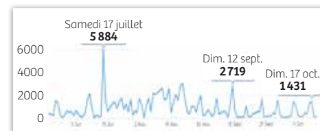
Fréquentation au lac Achard en 2021

Malgré un été maussade, les éco-compteurs mis en place en juin nous ont permis d'estimer à plus de 55 000 les entrées sur le lac Achard entre fin juin et le 19 octobre. Il est donc essentiel de maintenir la présence du garde vert lors des prochaines saisons estivales. ▶