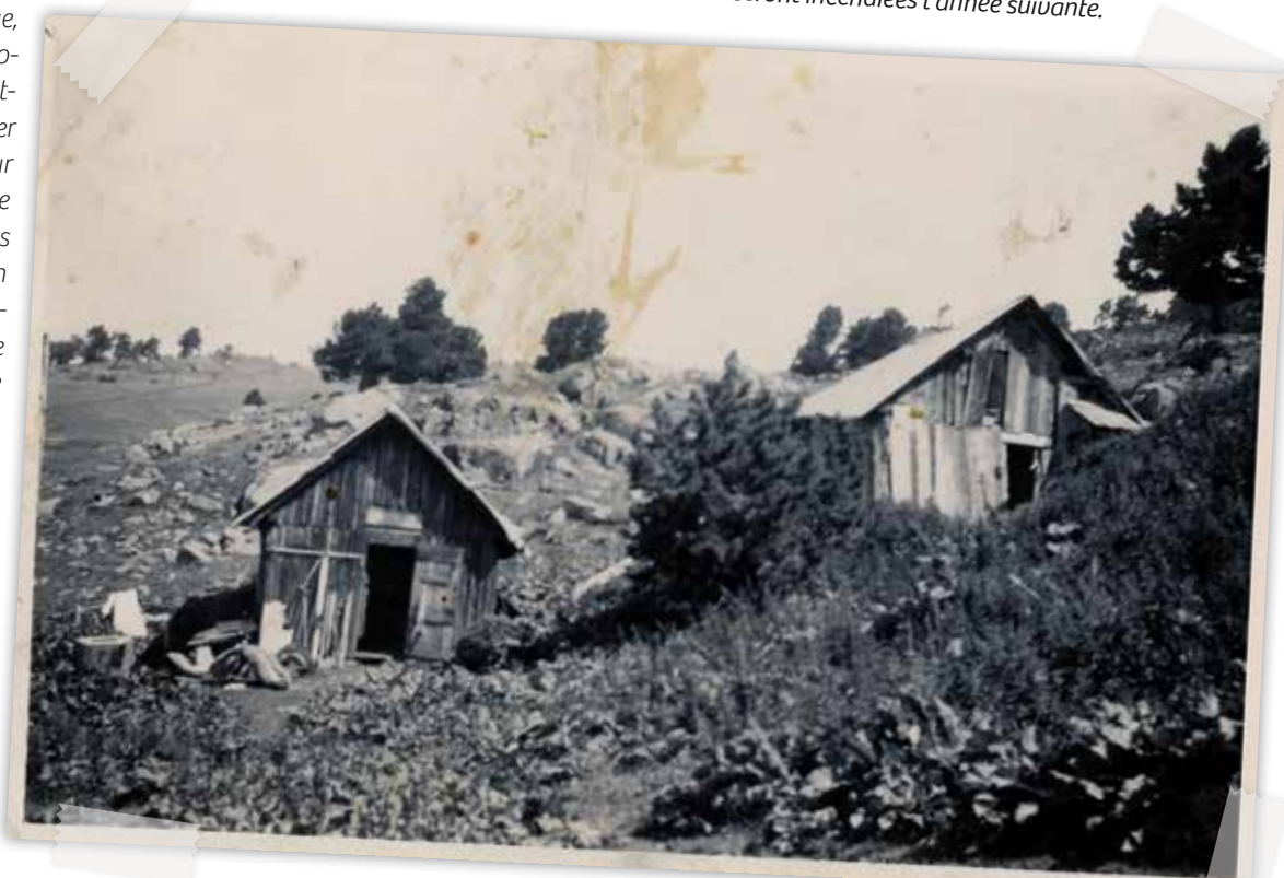
Les cabanes de Roche-Béranger en 1943. Elles seront incendiées l'année suivante.

Et ce afin de pouvoir, par la suite, réutiliser ces photos sur différents supports en les complétant par des informations très factuelles. Le mode de vie pastoral, c'est-à-dire la facette domestique, et la gestion de l'alpage, autrement dit la facette technique, sont les thèmes principaux de ces photos. Mais les photos n'étant pas datées, il était difficile de classer ce corpus par ordre chronologique. Pour autant, on observe très bien le passage d'un système d'estive locale, où les bergers partent de Saint-Martin d'Uriage pour aller jusqu'à Chamrousse avec une dougaine de vaches laitières, à un système de grande transhumance où les bergers partent de la Camargue pour se rendre sur les alpages de Belledonne avec 3000 brebis. Il faut expliquer qu'après la guerre le père de Joël Villard louait ses services de berger en Provence. Au fil du