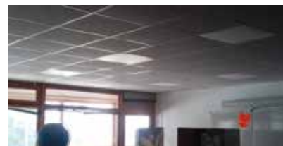
Panneaux leds à l'école

Du matériel d'exposition a également été installé à l'office du tourisme. ▶