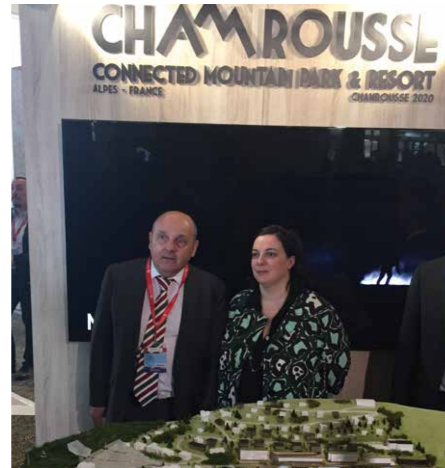
Philippe Cordon et Emmanuelle Cosse (parti Europe Écologie Les Verts), alors Ministre du logement... devant la maquette « Chamrousse 2030 ».

Ainsi plusieurs lots ont été constitués sur l'ensemble du projet avec le cabinet AKTIS (lauréat du concours d'architectes et d'urbanisme lancé en 2015). Un premier retour des investisseurs potentiels a été demandé pour le 15 juin avec la remise d'un dossier de candidatures. Dans un deuxième temps, la collectivité pourra entrer plus en détail avec les promoteurs pressentis pour pouvoir, d'ici la fin de l'année, faire un véritable choix et définir l'échéancier précis des premiers travaux (cette deuxième phase sera constituée d'une sélection sur esquisse).