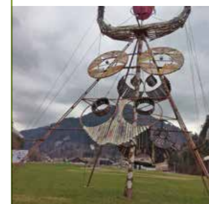
La vache du village d'Abondance faite avec des skis et une cabine de téléphérique.

A noter que certains commerçants nous ont informés qu'ils recycleraient aussi leur matériel par d'autres circuits – partenariat avec le CMTC de Meylan ou associations étudiantes. Certains ont également fait l'effort cette année de réparer plutôt que de jeter. Au final, l'objectif consiste à jeter pour transformer ou donner ou revendre ou encore faire des œuvres d'art.