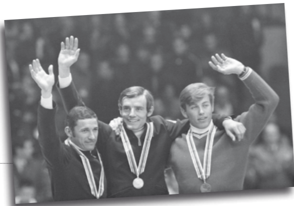
Un moment mémorable des JO, Jean-Claude Killy sur la plus haute marche du podium, entouré par Guy Périllat (France, argent) et Jean-Daniel Dätwyler (Suisse, bronze).

Dernière étape de ce projet, une rencontre festive est prévue le 13 juin 2017 sur l'anneau de Vitesse de Grenoble avec tous les élèves ayant participé. Au programme: parcours du flambeau, lecture de la charte olympique, ateliers olympiques et jeux athlétiques interclasses. Bref, autant d'activités qui nous l'espérons, ranimera la flamme olympique des X e Jeux d'hiver !