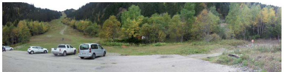
Casserousse avant / après

La Caisse des Dépôts pourrait octroyer un prêt long terme sur l'enveloppe des fonds d'épargne dédiée aux collectivités locales pour leurs nouveaux investissements. ▶