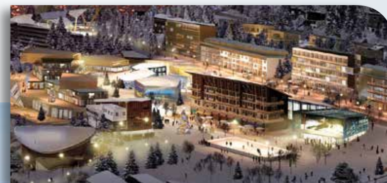
La salle multi-usages / multi-média et la patinoire