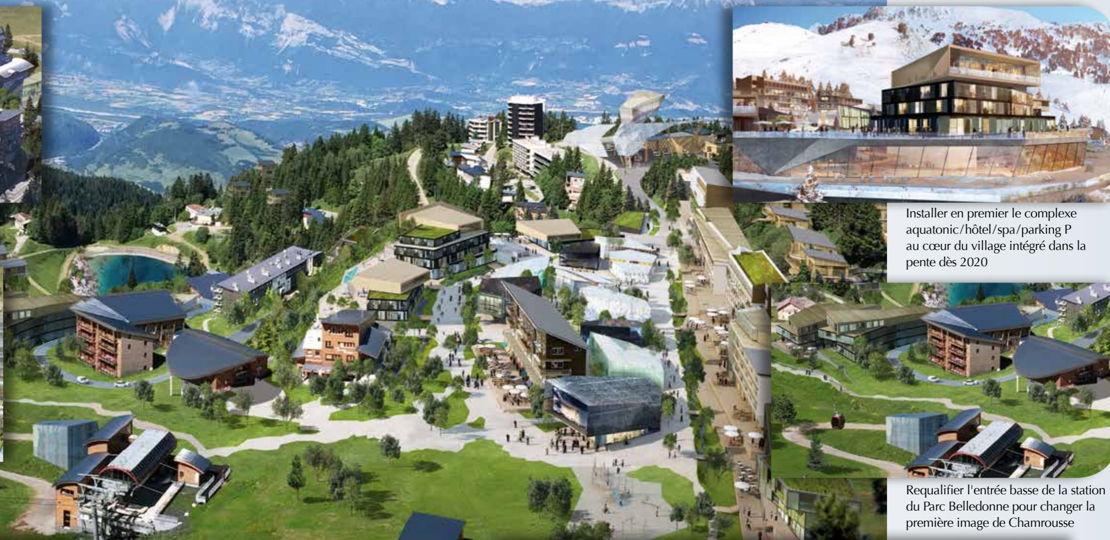
Requalifier l'entrée basse de la station du Parc Belledonne pour changer la première image de Chamrousse