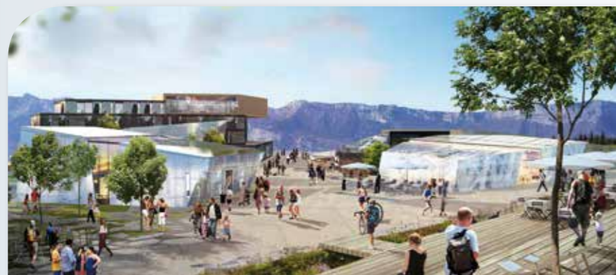
Préserver les vues sur les grands paysages ou sur les alpages (les pistes)... et l'ensoleillement pour tous!