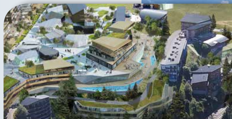
Fabriquer une identité architecturale repérable avec des façades contemporaines alliant verre et bois.