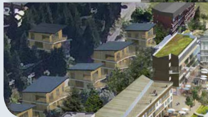
Accueillir de nouveaux habitants et de nouveaux touristes (+562 logements à terme) soit environ 2000 lits supplémentaires en 15 ans