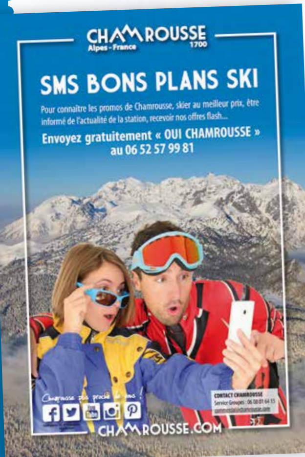
L'offre Chamrousse affichée dans les locaux étudiants des universités et grandes écoles de Lyon, Grenoble et Valence.

→ Des opérations de partenariats comme l'émission sur France 2 « Tout le monde veut prendre sa place » en octobre, une journée en direct de Chamrousse avec déplacement du plateau radio France Bleu à la Croix le 18 décembre, des spots stations sur les écrans de plus de 20 boulangeries de la région, une participation active aux opérations d'Isère Tourisme et France Montagnes, d'Espace Belledonne, du Grésivaudan, une nouvelle coopération avec les Offices de Tourisme d'Uriage et de Grenoble Alpes Métropole.