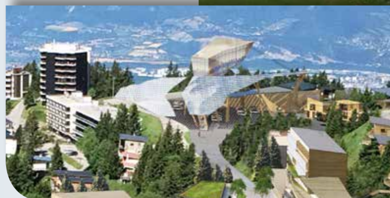
Mettre en scène l'arrivée du télécabine Grenoble-Chamrousse