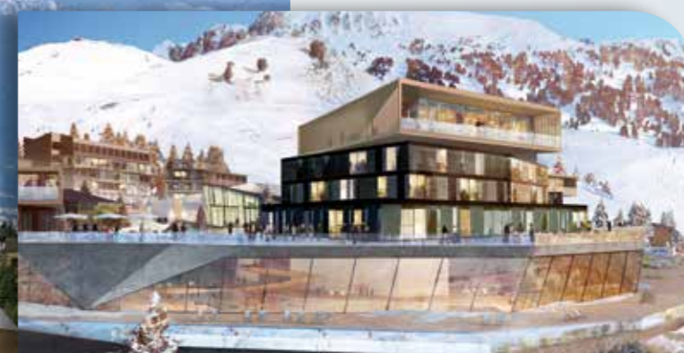
Installer en premier le complexe aquatonic/hôtel/spa/parking P au cœur du village intégré dans la pente dès 2020