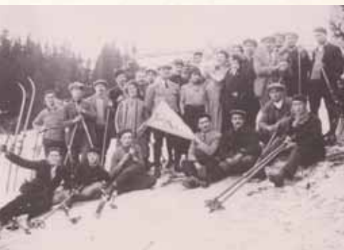
Premier concours officiel du ski club de Chamrousse (29 janvier 1930)