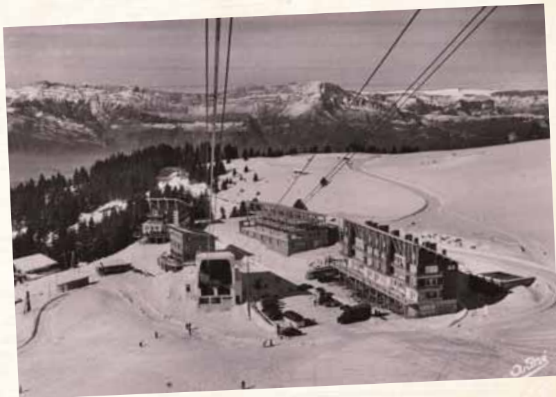
Les premiers immeubles qui fleurissent autour de la gare de départ du téléphérique au Recoin de Chamrousse en 1952 (la Résidence, La Grenouillère, les Marmottes, l'Ourson et l'Hermitage en construction).