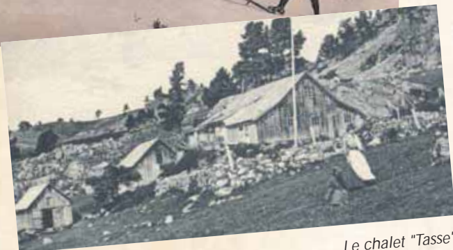
Le chalet "Tasse"