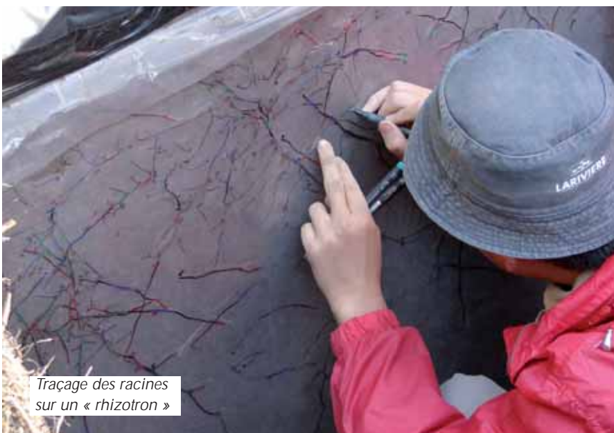
Traçage des racines sur un « rhizotron »

Ainsi Chamrousse, village traditionnellement plus connu pour ses activités liées aux sports d'hiver, est devenu un des « hotspots » de recherche en écologie et éco-ingénierie en France. » ▶