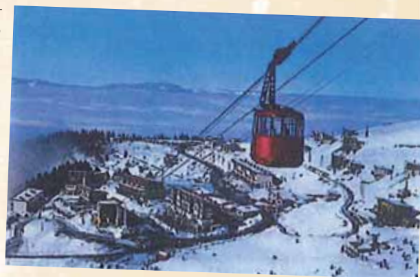
Le téléphérique conçu par la société Neyret-Beylier en 1952, d'une longueur de 2 000 mètres et d'une dénivellation de 600 mètres. Les câbles reposent sur quatre pylônes dont le plus grand atteint un peu plus de 50 m.