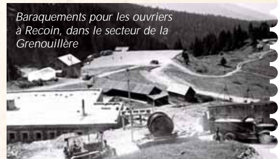
Baraquements pour les ouvriers à Recoin, dans le secteur de la Grenouillère

Avant la construction du téléphérique, les skieurs grenoblois pouvaient faire glisser leurs spatules sur des pistes déjà aménagées à Recoin : le premier télésiège de "l'Aiguille" aux pylônes en bois et "la Grenouillère".