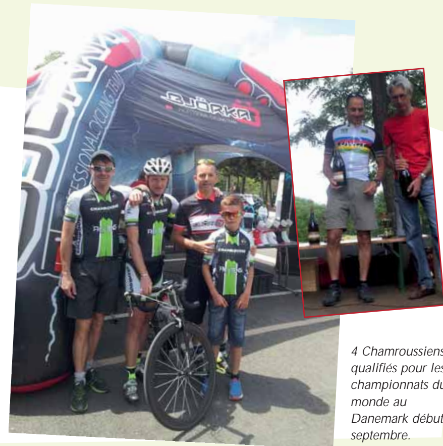
4 Chamroussiens qualifiés pour les championnats du monde au Danemark début septembre.